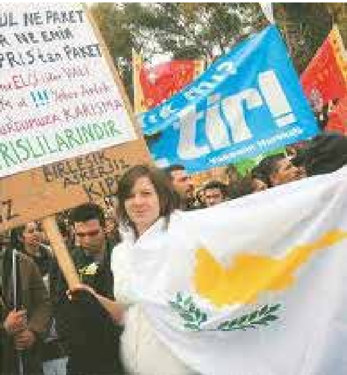
ΣΥΛΛΑΛΗΤΗΡΙΟ ΤΚ ΓΙΑ ΤΗΝ ΕΠΑΝΕΝΩΣΗ