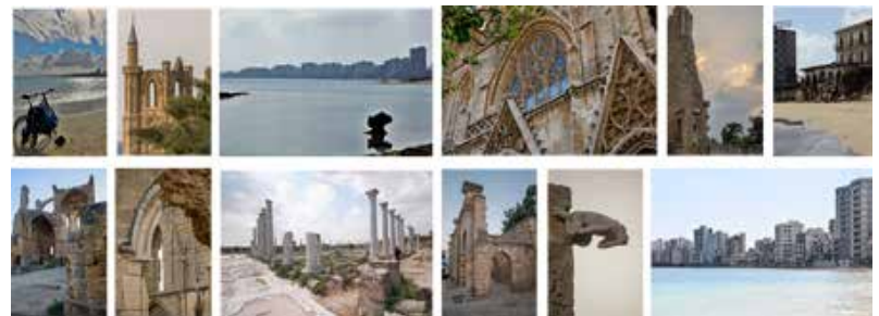
Έκθεση Φωτογραφίας Πέτρου Φιάκκα «Αμμόχωστος, η ψυχή και η πορεία ενός Βασιλείου»

(Τα εξώφυλλα του 2017 θα έχουν ιστορικούς χάρτες της Κύπρου)