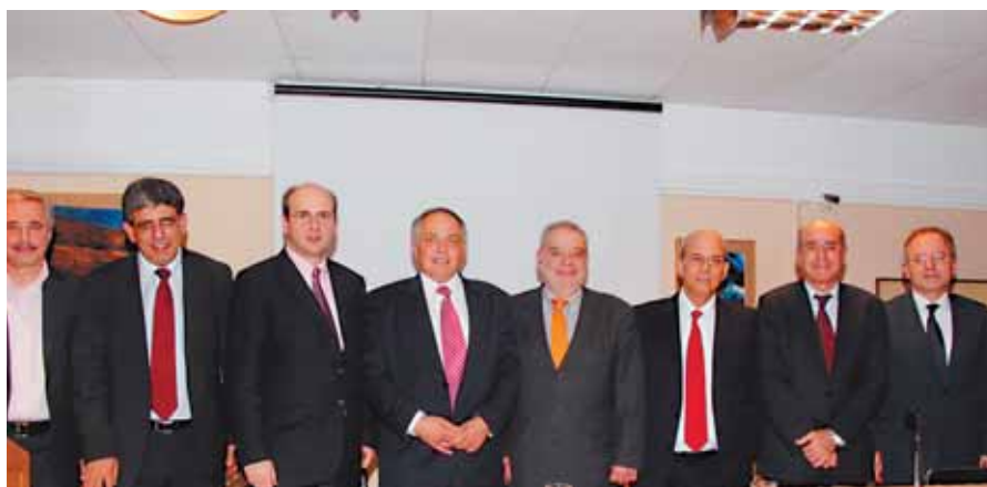
Εκδήλωση για ΑΟΖ Κύπρου