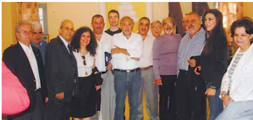
Από τη συνεδρίαση του Κ.Σ. της Ο.Κ.Ο.Ε. στην Ρόδο στις 22 Οκτωβρίου και την Έκθεση για την σύληψη της Πολιτιστικής Κληρονομιάς της Κύπρου στην Κατεχόμενη Κύπρο.